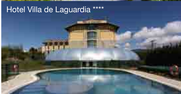
Hotel Villa de Laguardia ****

5 días / 4 noches Desde 180€/persona Días laborables (domingo a jueves)